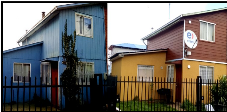
Vivienda intervenida año 2018.

- Adultos Mayores con R.S.H 70% en adelante y sin R.S.H 3 UF