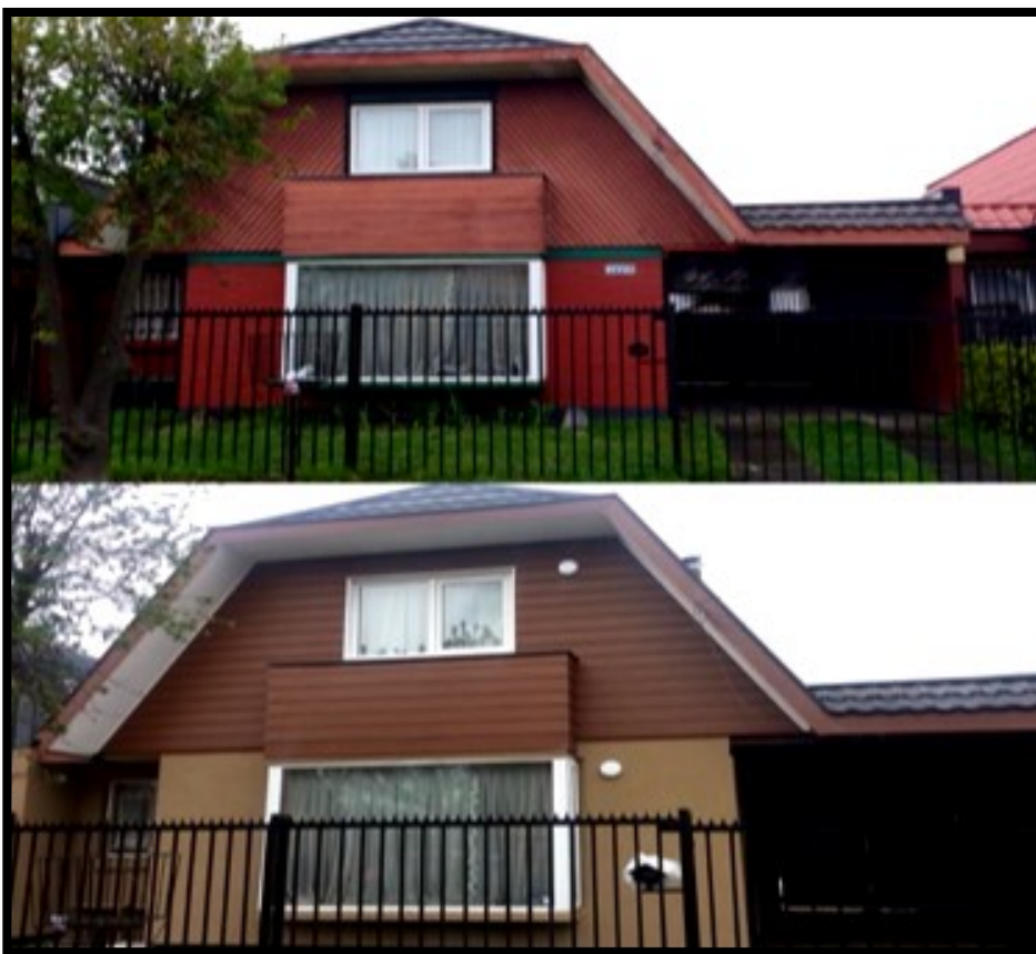
Vivienda villa Juan Pablo II

Como empresa siempre nos hemos centrado en nuestros clientes, conscientes de que nuestros trabajos mejoran su calidad de vida.