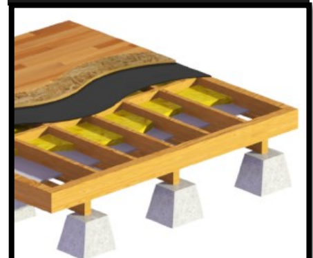
Aislación de piso ventilado.